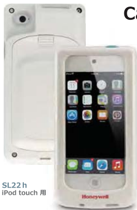
SL22 h iPod touch 用

カバー前面のスクリーンプロテクターがAppleデバイスを汚れや傷から保護します。