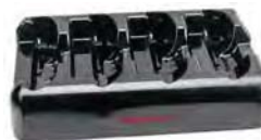
SL62専用 4連チャージベース