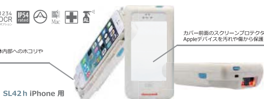
SL42 h iPhone 用