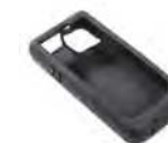
読み取り専用モデル用

SL22/SL42本体を傷や汚れから保護するラバークリアです。作業時のグリップ感を向上させ、滑り落ちなども防止します。