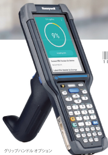
グリップハンドルオプション

Mobility Edgeプラットフォームを採用 Android OS のアップグレード対応により長期運用 長時間運用 5,200mAhスマートバッテリー搭載