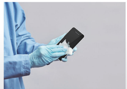
アルコール清拭可能な耐薬品プラスチックを採用